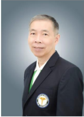
ศ.นพ.สุวัฒน์ เบญจพลพิทักษ์ แพทย์ผู้เชี่ยวชาญ สาขา กุมารเวชศาสตร์โรคภูมิแพ้และ ภูมิคุ้มกัน