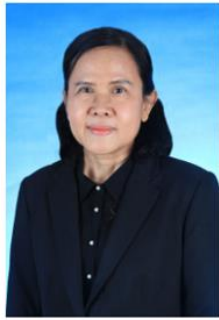
พ.ด.อ.หญิงระพี ดิษฐจร