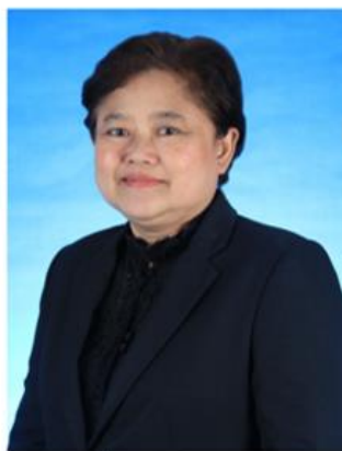
หัวหน้ากลุ่มวิชา